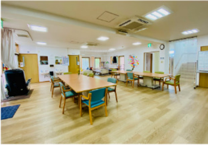
アクティビティの為のメインフロアー