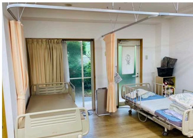
迅速なリスク対応の為に看護職員が常にフロア全体を見回せる構造になっています。