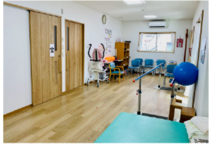
個別機能訓練に対応した環境を整備